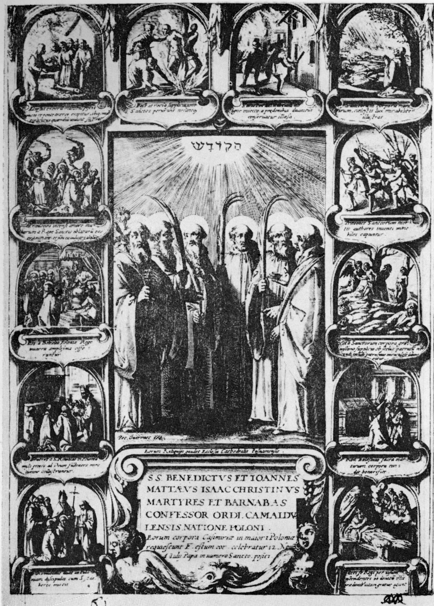
1. Pięciu Braci Męczenników. Miedzioryt z serii Icones et miracula Sanctorum Poloniae . Ryt. P. Overadt, Kolonia, ok. 1605 r. Gabinet Rycin PAN Kraków. Fot. Zb. Kos.