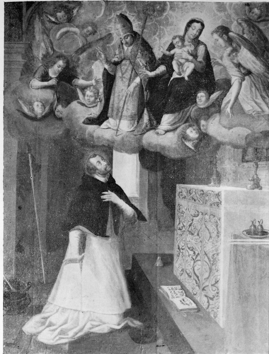
5. Kościół Bożego Ciała w Krakowie. Wizja Stanisława Kazimierczyka w kościele na Skałce. 1 ćw. XVII w. Obraz przypisywany Ł. Porębskiemu.