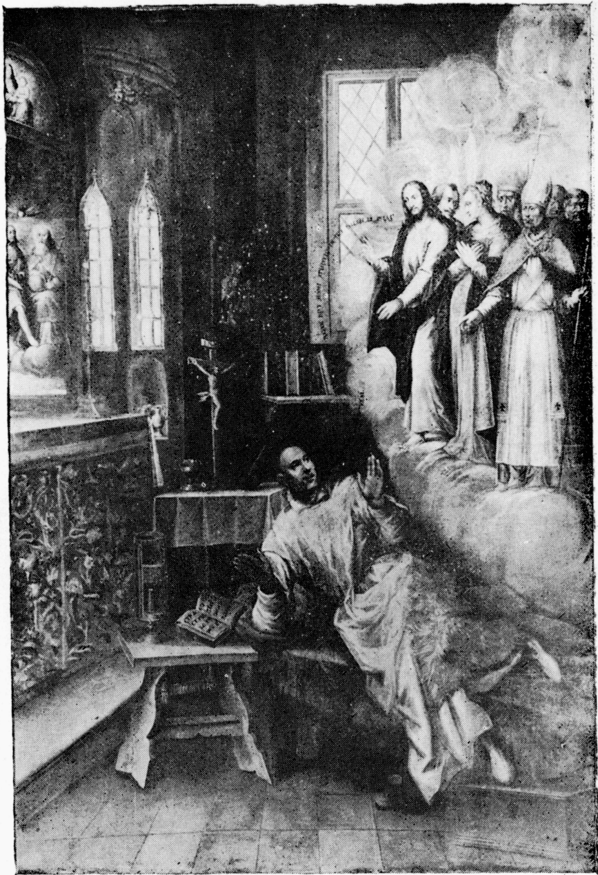
6. Kościół Bożego Ciała w Krakowie. Śmierć Stanisława Kazimierczyka. Mal. Ł. Porębski, 1619 r.