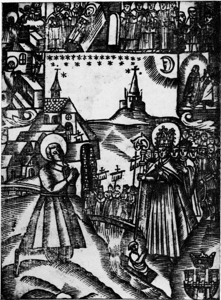
4. Świętosław Milczący.