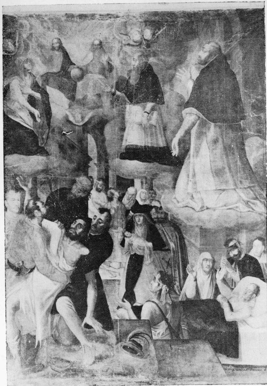
7. Kościół Bożego Ciała w Krakowie. Uzdrawienie za przyczyną Stanisława Kazimierczyka. Mal. Ł. Porębski, 1619 r.