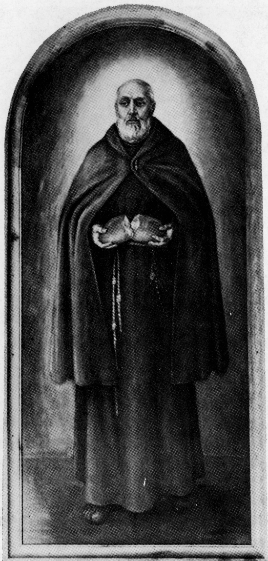
2. Bł. Brat Albert. Mal. S. Lidia Pawełczak, 1983. Kraków, kościół Ecce Homo