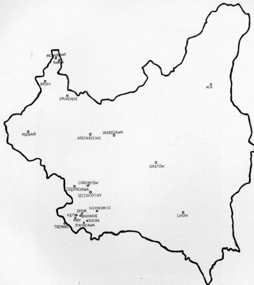
3. Placówki Zgromadzenia Sióstr Zmartwychwstania Pańskiego w Polsce w latach 1918-1939.