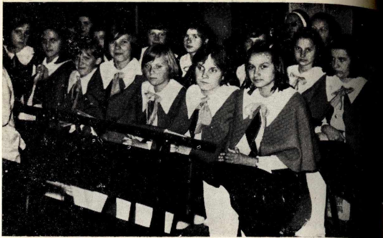
53. Schola dziewczęca z parafii Matki Boskiej Zwycięskiej w Toruniu.