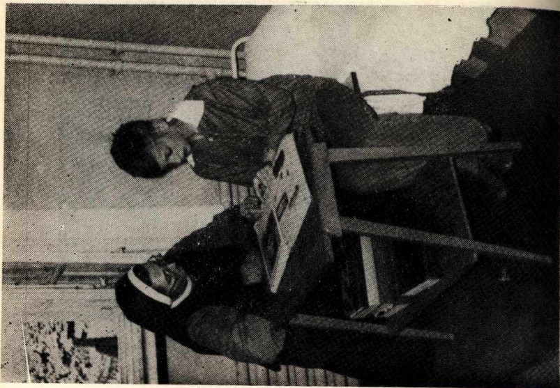
58. Naukę czytania w Zakładzie Wychowawczym