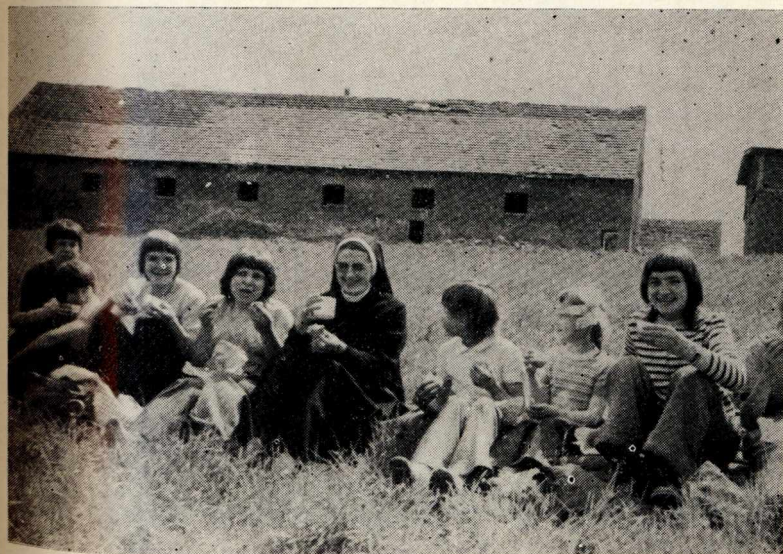
52. Na wycieczce z młodzieżą. Zakrzewo.