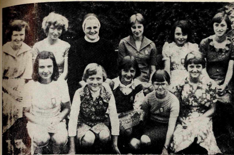
55. Rekolekcje. Grudziądz 1979 r.