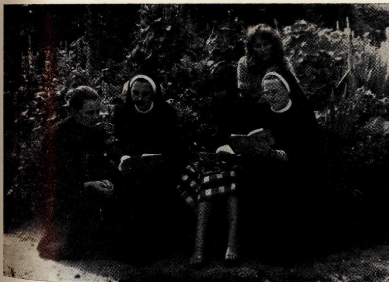
56. Śpiew w ogrodzie z rekolektantkami. Grudziądz 1979.