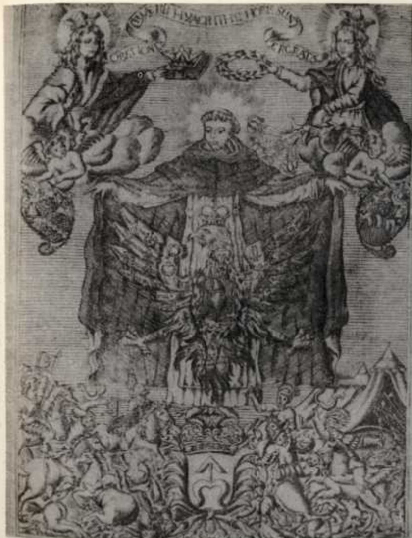
1. Św. Jacek. Reprod. z dzieła D. Frydrychowicza, S. Hyacinthus Odrowskius (Kraków 1688).