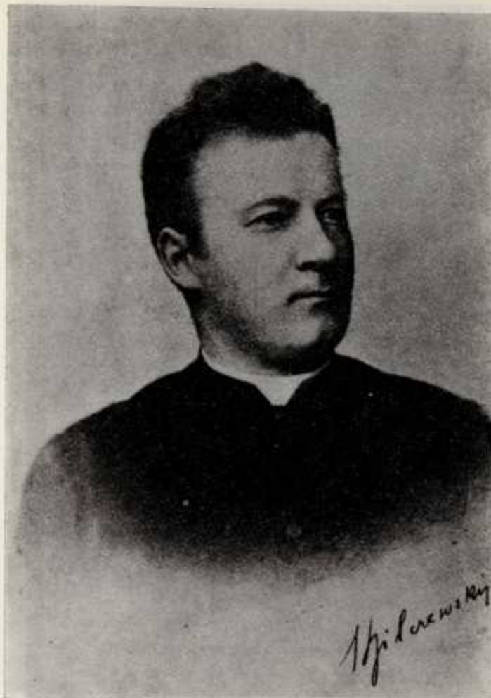
31. Ks. Józef Bilczewski w okresie profesury w Uniwersytecie Lwowskim