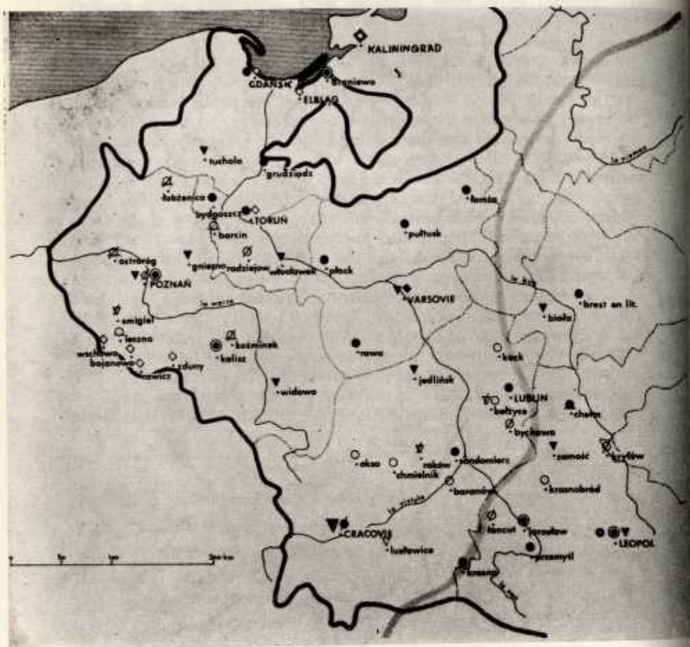
25. Pologne occidentale: les écoles de 1600 à 1648